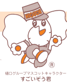
樋口グループマスコットキャラクター すごいぞう君

京都の気候風土にあった家づくりを信念にお陰さまで創業39年を越えました。地味な会社です。ご存知でない方が大半でしょう。しかしこれまで口こみを中心に地道にやってきました。